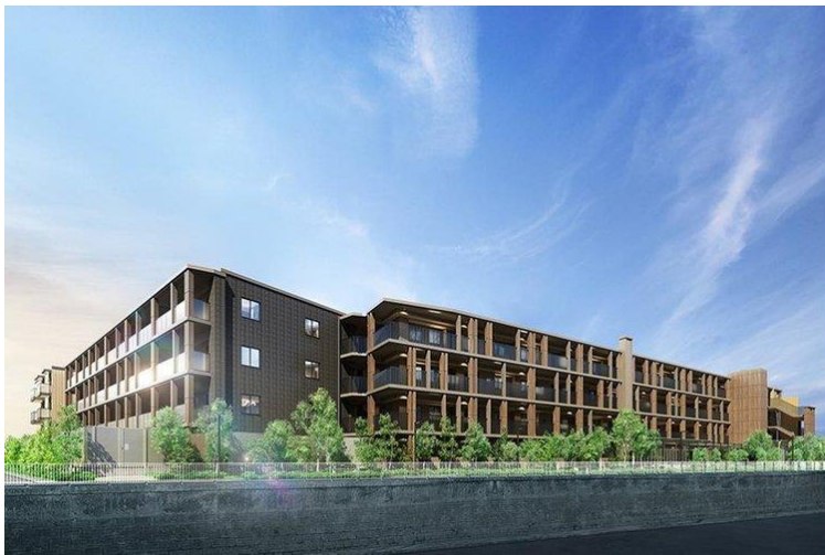
「ジオ荻窪」外観(パース)

所在地：東京都杉並区荻窪二丁目 535 番 1 他(地番) アクセス：JR 中央線、東京メトロ丸ノ内線「荻窪」駅徒歩 12 分 敷地面積：7,013.96 m 2 ※位置指定道路含む ※建築確認対象敷地面積/6,716.42 m 2 構造・規模：鉄筋コンクリート造 地上 4 階 総戸数：99 戸 竣工：2026 年 3 月下旬(予定) URL： https://geo.8984.jp/mansion/geo-ogikubo