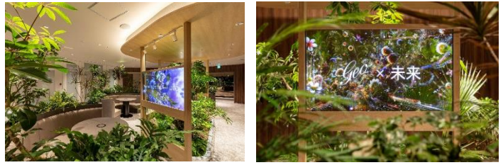
豊かな植栽に囲まれた透明ディスプレイ

ここでは、緑の中に透明ディスプレイを設置し、当社の事業展開やSDGs 施策など、“今と未来”の取組を紹介します。