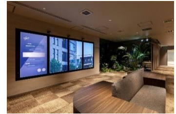
タッチ式4面サイネージ

デジタルアートが人の動きに合わせて美しく変化する「アートモード」と、タッチパネルで〈ジオ〉ブランドの分譲実績や、品質管理・商品企画、オーナー会員さまへの取組を紹介する「geo 説明モード」を用意しました。