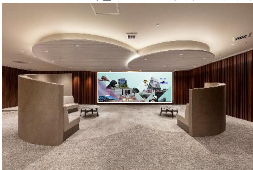
大型LEDモニターのあるエントランス ウェイティングゾーン

大型LEDモニターで、当社を含む「阪急阪神東宝グループ」の紹介映像を放映。グループのアイデンティティを発信します。