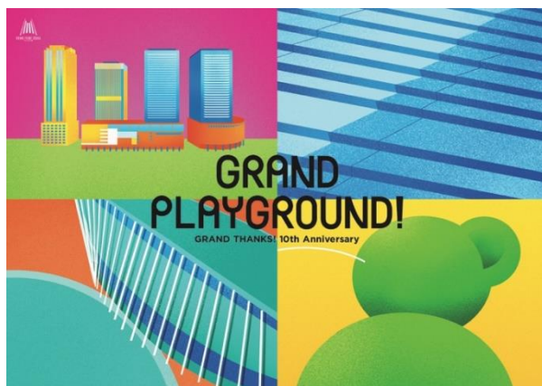
「GRAND PLAYGROUND!」メインビジュアル

まちびらき10周年を迎えるにあたり、そしてこれからの10年間を見据え、この度グランフロント大阪では新ビジョンを策定しました。「 創り出そう、ともに。 」をスローガンに、これまで以上に多様な人々を巻き込み、進化に挑戦しつづけるまちを目指します。その新ビジョンを来街者の皆さまに体感いただくためのテーマは、「 GRAND GRAND PLAYGROUND PLAYGROUND!」。まち全体をグランフロント大阪らしい「 GRAND グラン(壮大)」「 PLAYGROUND みんなの遊び場」にすることで、大人も子どもも自然にまちに集まり、訪れるすべての人がワクワクし、新たな感性と意欲が湧いてくる——「遊ぶ」という主体的な行いを通じて、来街者の皆さまがまちを再発見するきっかけをつくることで、長く愛されつづけるまちを目指します。