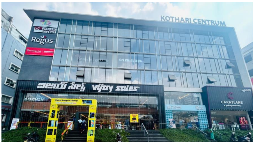
Regus Hyderabad Kothari Centrum