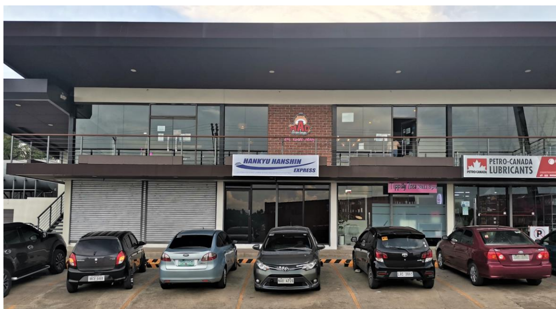
▲ダバオ事務所外観