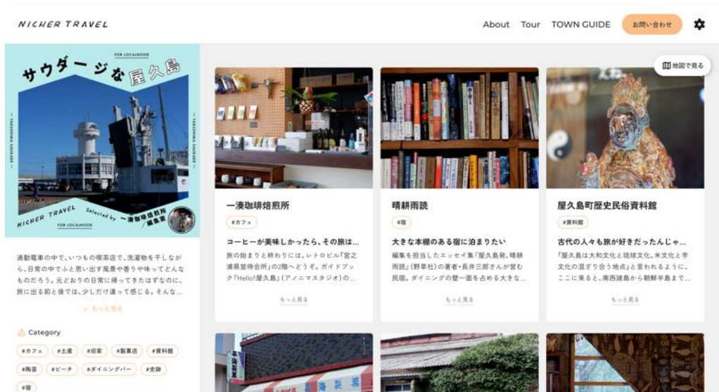
スポット情報画面