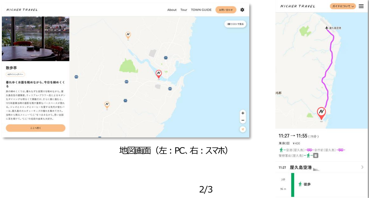
地図画面（左：PC、右：スマホ）