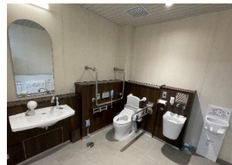
バリアフリートイレ