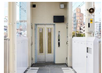
エレベーター（ホーム上より）