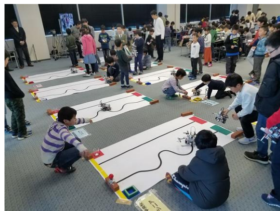
<プログラボオリジナルコンテストの様子(2017年)>