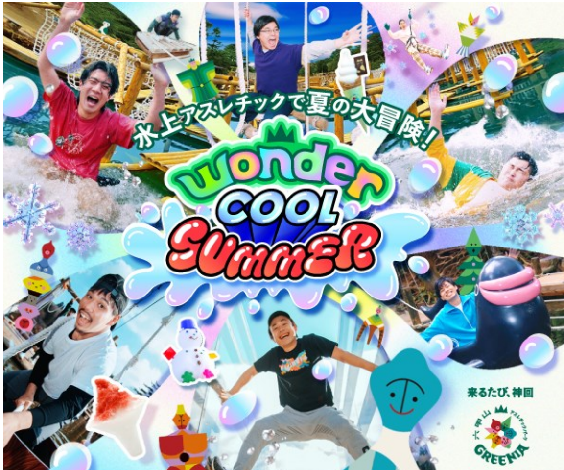
夏広告ビジュアル

また、六甲山上の気候は北海道南部と近く、市街地との気温差が約-5℃あります。避暑地としても最適な六甲山では、夏でも爽やかな風を感じながら体を動かして楽しめます。