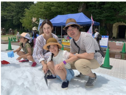
雪あそびイメージ

※雪がなくなった場合は、雪あそび&雪玉ストラックアウト広場を終了させていただきます。