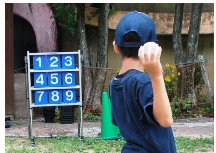
雪玉ストラックアウトイメージ