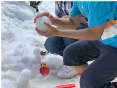
雪の広場イメージ