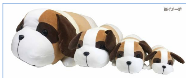
くじ引き専用景品ぬいぐるみ(ヨーゼフ)イメージ