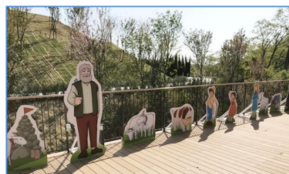
キャラクターパネル設置イメージ

キャラクターパネルや、キャラクターの特大ぬいぐるみが登場。 異国情緒漂うエリア内で、アルプスの少女ハイジのキャラクターと 一緒に写真を撮影できます。