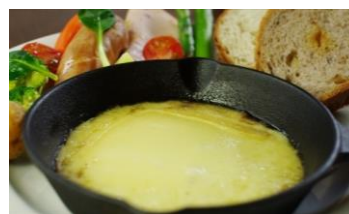
「ラクレットチーズプレート」