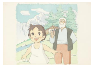
小田部羊一氏 原画