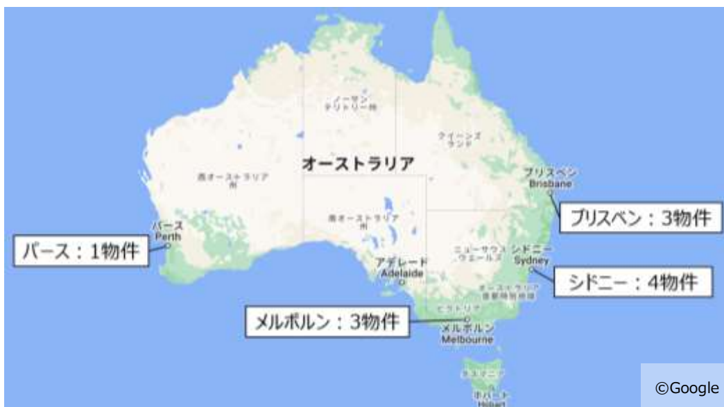
本物件の所在エリア

当社では、2023年にHHPAUSを設立し、シドニーの複合施設「60 Margaret」を取得することでオーストラリアへの事業進出を図っておりますが、今後も引き続きオーストラリアにおける不動産事業の拡大を進めてまいります。