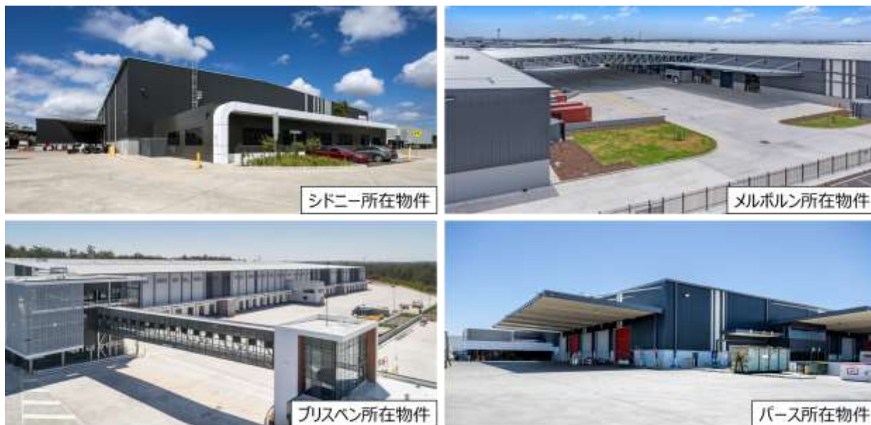
本物件の写真（代表物件を掲載）