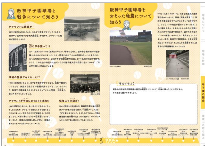
<小学3年生～6年生用(甲子園の歴史)>