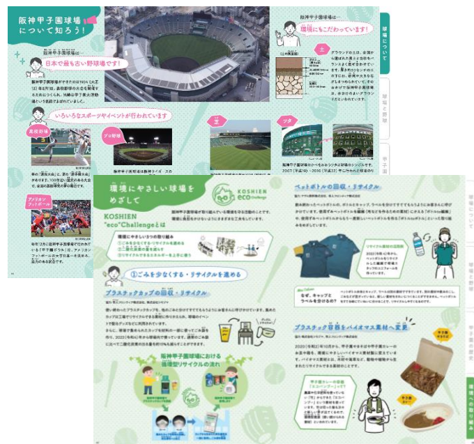
＜甲子園歴史館ワークブックのイメージ＞