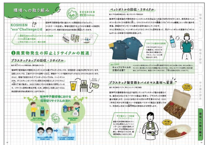
<中学生～高校生用(環境への取り組み)>