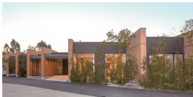
エテルノ阪急千里