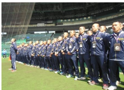
校歌斉唱プラン（イメージ）