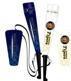
オリジナルグッズ（一例）