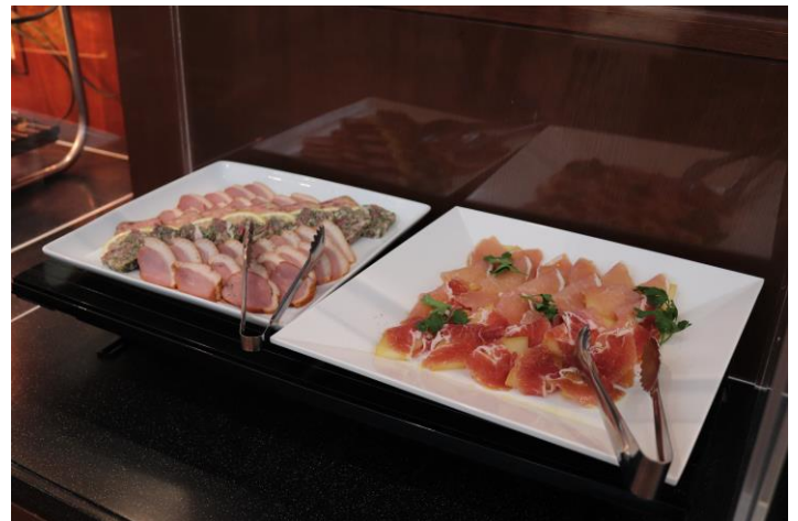
プレミアムラウンジ等での食事（イメージ）