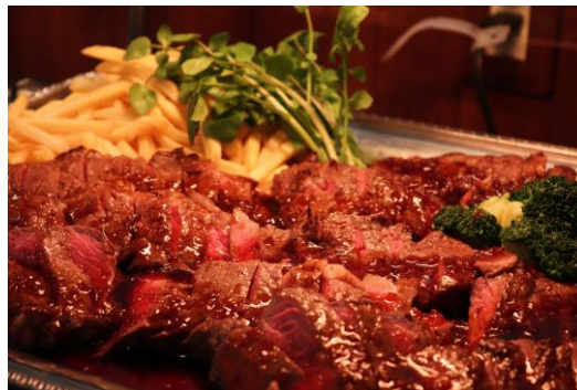
満喫プラン（食事イメージ）

※別途、1,500円（税込）/1名でアルコール飲み放題に変更可能（変更の場合は大人の方全員に適用）。