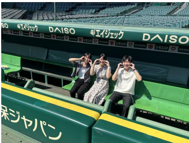
スタジアムツアー（イメージ）