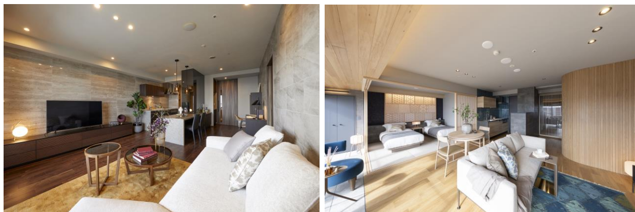
トラストグレイス御影