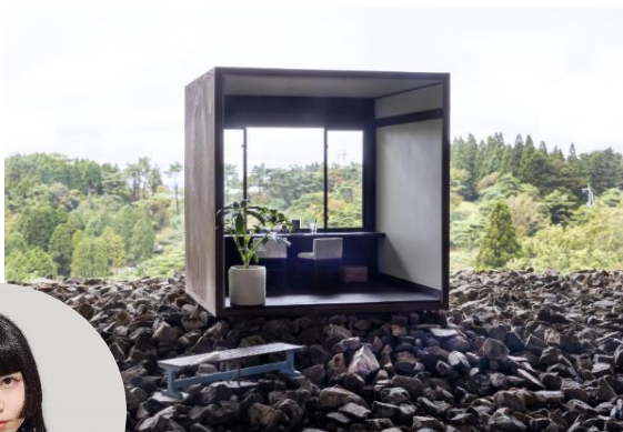
六甲ミーツ・アート公募大賞 グランプリ作品 上坂直《六甲景鏡》 2020年 自然体感展望台 六甲枝垂れ