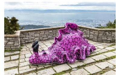
灰野ゆう「あめふらし」 (六甲ミーツ・アート 芸術散歩 2020 出展) 神戸市購入予定