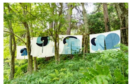
史枝《連なる思い》 2020年 六甲高山植物園