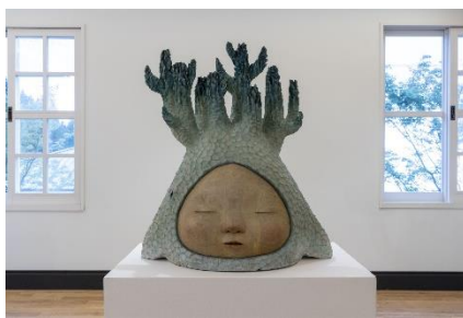
中村萌《Grow in silence》 2020年 六甲山サイレンスリゾート