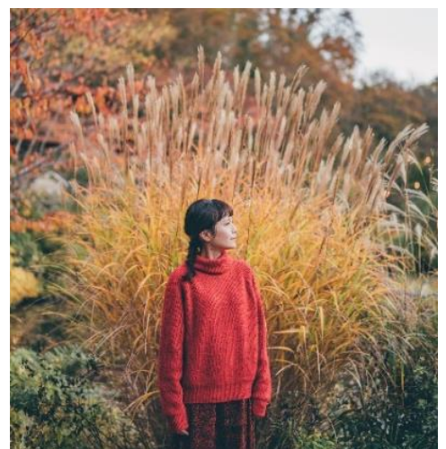
投稿写真イメージ