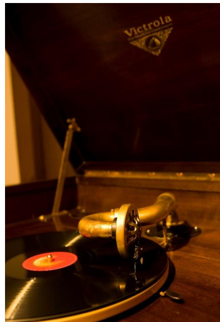
蓄音器「ビクトローラ・クレデンザ」(部分) 1925～1928年頃 アメリカ製