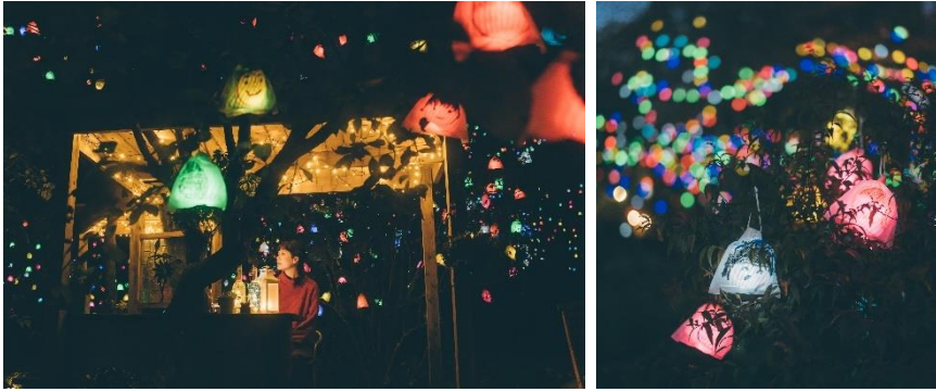
「六甲ミーツ・アート芸術散歩 2023 beyond」展覧作品 《ひかりの実 in SIKI ガーデン》(2022年展示の様子) 作: 高橋匡太