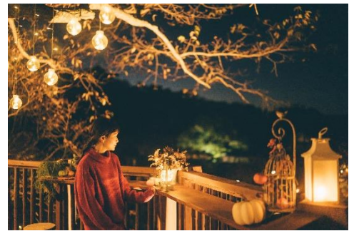
夜のツリーハウス(2022年の様子)