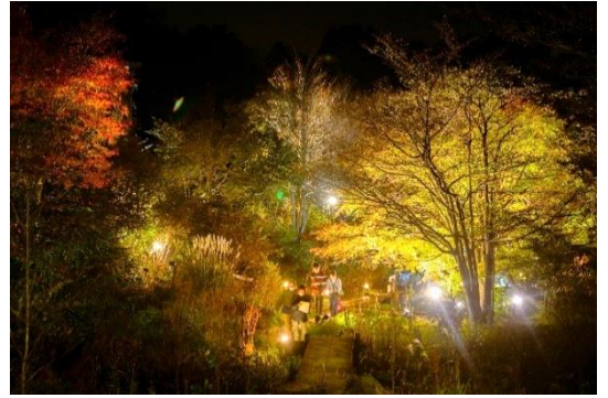
紅葉ライトアップ(2022年の様子)