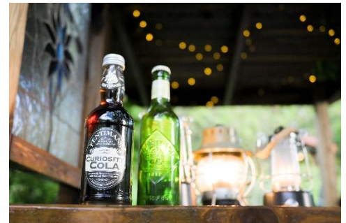
トワイライトカフェ(イメージ)

※「トワイライトカフェ」のご利用にはナイトパス、もしくはナイトパス付き鑑賞パスポートが必要です。