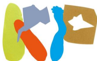
konohana permanentale 100+

近畿大学の学生と此花区に住む小学生が共同制作したロゴ。企業ロゴのように単一のイメージを一方向的に押し付けることなく、さまざまなアート作品が混在するkonohana permanentale 100+の多様性を、複数の小学生が折り紙をちぎったかたちを組み合わせた文字で表現。既存書体をつかわない自由なこの文字は複数のバリエーションを持ち、状況によってかたちを変えます。温もりを感じさせ気取りのないこのロゴは、此花の街のもつ人間らしさを表象し、ふだん芸術祭となじみがない人たちに対しても親しみやすさを訴求します。