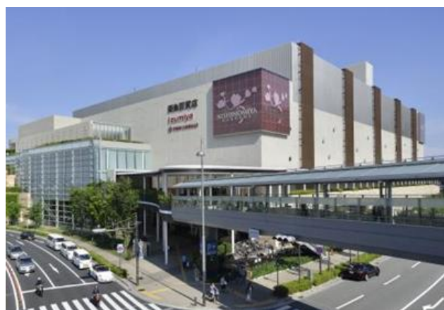
阪急西宮ガーデンズの外観

※ 既設の防犯カメラシステムをAI化できる施設向けAI警備システムで、カメラ映像の中から異常行動（転倒、卒倒、ケンカ、破壊行動）や不審行動（千鳥足、ふらつき）など、通常の行動から逸脱した「違和感行動」をリアルタイムに検知・通知することが可能です。