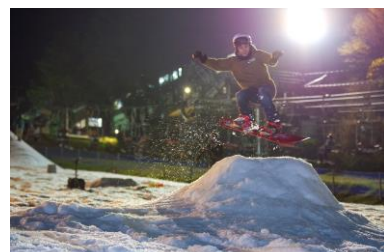
過去の various lines.の様子