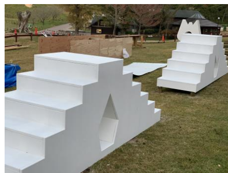
建設中のアスレチック

春から秋にかけて同施設内で営業している「六甲山アスレチックパーク GREENIA」から幼児向けのアスレチックが登場します。グリーンアのキャラクターで彩られたアスレチックは、ブランコやすべり台など難易度を低く設定しているため、ウェアを着たまま遊ぶことができます。