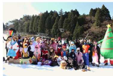
昨年のコスプレ来園者の様子