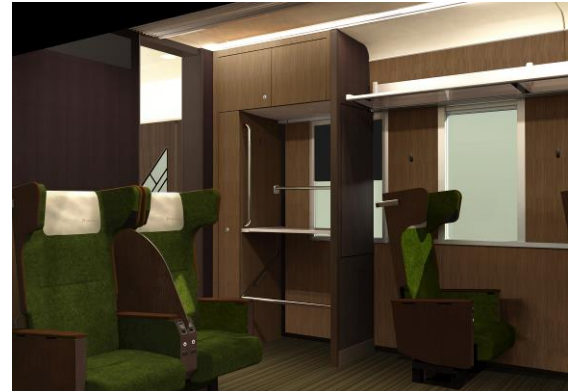
共用荷物コーナーのイメージ

車いすスペースに隣接する座席を、車いすをご利用のお客様の優先席としています。予約方法や利用方法については、決まり次第お知らせします。