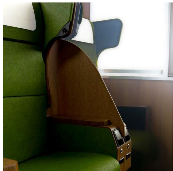
パーテーション部のイメージ