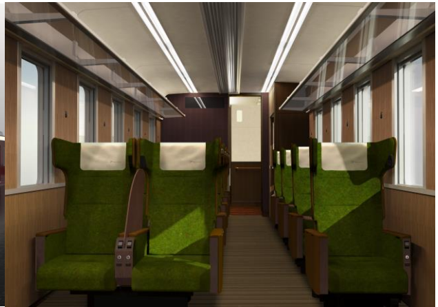
客室内のイメージ

阪急電鉄では、当社初となる座席指定サービス『PRiVACE(プライベース)』を、2024年7月から導入します。プライベースは、「日常の“移動時間”を、プライベートな空間で過ごす“自分時間”へ」をコンセプトとしており、京都線の新型特急車両2300系及び同線で主に特急系車両として運行している9300系(一部)のそれぞれ大阪方から4両目に設定して運行します。