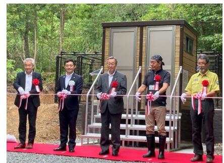
6月9日落成式テープカットの様子

<報道関係の方からのお問い合わせ先> 株式会社阪急交通社 広報部 TEL：06-4795-5711（大阪） / 03-6745-7333（東京）