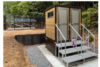
金作原バイオトイレ