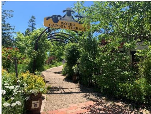
イングリッシュ・コテージガーデン

期間中、自然の草花を活かした庭造りが特徴の英国風庭園「イングリッシュ・コテージガーデン」では、クロッカスやムスカリ、チューリップなどの小さな球根の花や、春を代表するプリムローズが咲き、牧草地のようにのびた芝生の中に野の花々が咲く「メドウガーデン」では、ラッパスイセンが開花し、春の訪れを感じることができます。