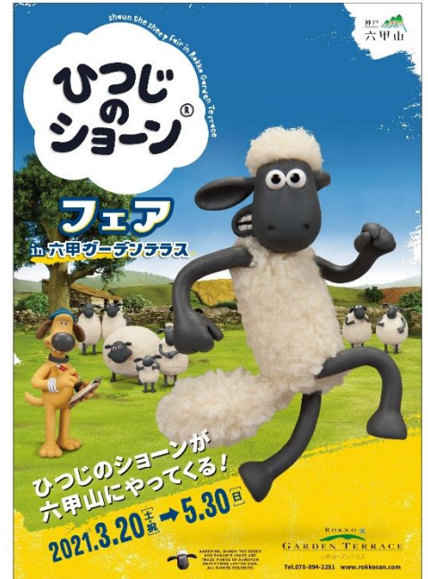
『ひつじのショーフェア in 六甲ガーデンテラス』

SHAUN THE SHEEP AND SHAUN'S IMAGE ARE ™ AARDMAN ANIMATIONS LTD. 2021