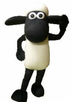
グリーティング (イメージ)