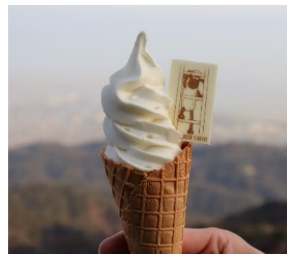
ひつじのショーンソフトクリーム