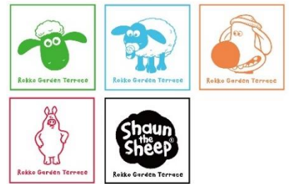
スタンプラリー (イメージ)