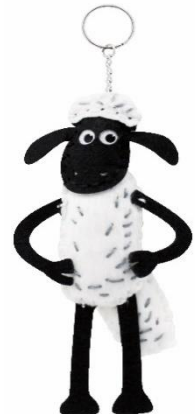
キーリング(イメージ)

※「ひつじのショーン」の画像をご使用の際には、必ず以下のコピーライトを表記下さい。 SHAUN THE SHEEP AND SHAUN'S IMAGE ARE ™ AARDMAN ANIMATIONS LTD. 2021