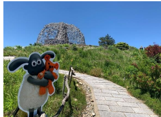
光と風のメドウガーデン