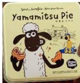
ひつじのショーンのやまみつパイ 1,210円