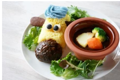
ビッツァーのよくばりビーフシチュー