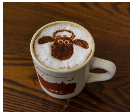
ひつじのショーンラテ