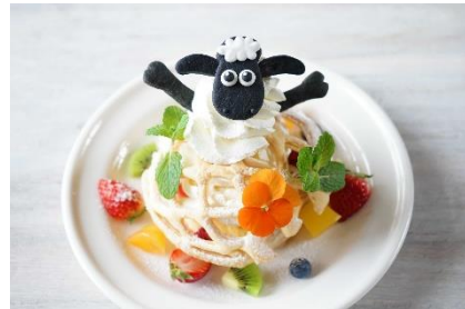
ひつじのショーンの春いちごサンドケーキ

ビッツァーの顔をあしらったプレートに、 六甲ビューパレス自慢のシェフ特製 ビーフシチューがたっぷり！