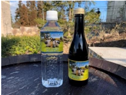
神戸ウォーター(左)173円 神戸ウォーターレモネード(右)346円

六甲山で採れたはちみつ「やまみつ」が入った、おみやげにぴったりの「やまみつパイ」や、バリエーション豊富な「バウムクーヘン」、エリア内で気軽に飲める「神戸ウォーター」・「神戸ウォーターレモネード」を販売。