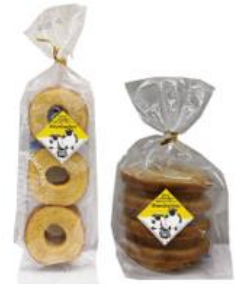
ひつじのショーンのバウムクーヘン (左)421円、(右)550円