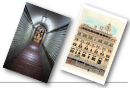
第14回阪急ええはがきコンテスト 最優秀賞 (左)「秘密の階段」@hitocamerayくろだゆうさん(写真部門) (右)「鴨川沿いのレトロな建物」足立明さん(絵画部門)

入賞発表 ● 2024年12月上旬、公式HPにて発表! ● 大阪梅田駅で作品をパネルに展示! ● 上位賞は「ええはがき」になり無料配布! ※入賞者以外への通知は行いません。