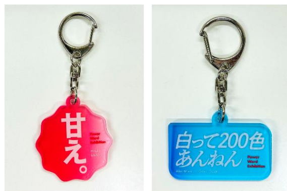
アクリルキーホルダー 「甘え。」「白って200色あんねん」