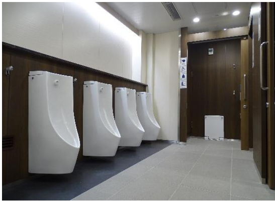
男性用トイレの内観