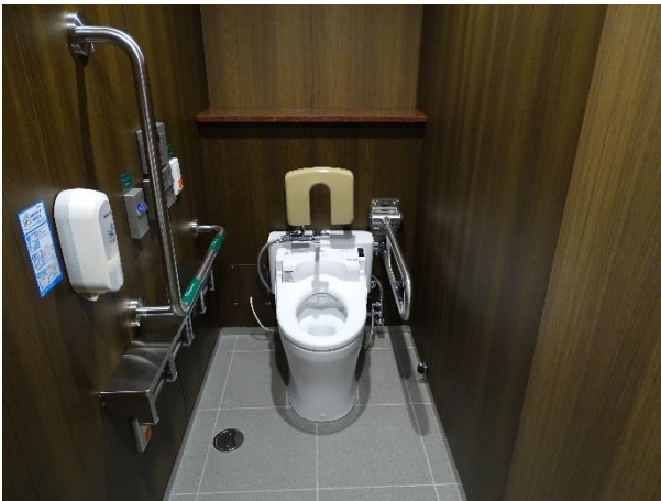
③: 簡易多機能ブース