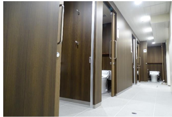
女性用トイレの内観

阪急電鉄では、神戸阪急ビル東館の建替え（2021年春竣工予定）にあわせて、神戸三宮駅のリニューアル工事を進めております。その一環として、このたび東改札構内トイレのリニューアル工事が完了し、9月4日（金）から供用を開始することとなりましたので、お知らせします。