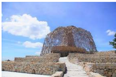
自然体感展望台 六甲枝垂れ

「六甲ミーツ・アート芸術散歩」は、六甲山上の観光施設を主な会場としています。オープンエアな環境で六甲山の自然とアート作品を楽しみながら、会場となる各施設それぞれの魅力もお楽しみいただけます。各会場は、六甲山上バス（路線バス：有料）の他、徒歩での移動も可能です。