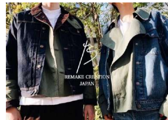
be released イメージ

さらに、この企画は 関西圏の大学生 のサポートを受けて運営されます。学生とのワークショップなどを通して、社会課題や表現することについて共に考えます。