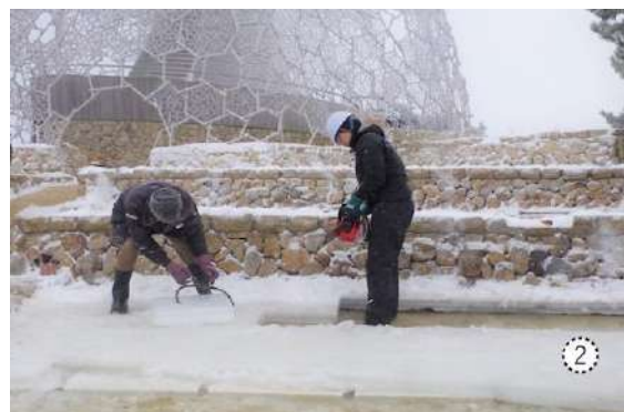
毎年大寒に行われる「氷の切り出し」の様子