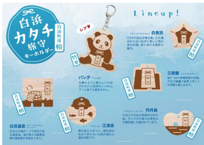
△ 「白浜がちゃ」ラインアップ