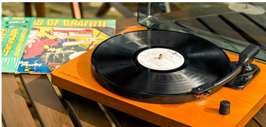
レコードプレーヤーと所蔵の LP レコード

六甲山観光株式会社(本社:神戸市 社長:寺西公彦)が運営する、ROKKO森の音ミュージアム内、森の Café では、2024年1月7日(日)~3月10日(日)の日曜日限定で、「森のレコード喫茶」を開催します。