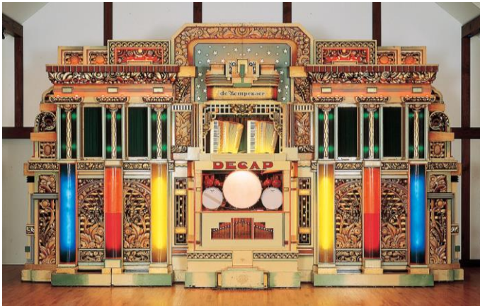
自動演奏オルガン「デカップ・ダンス・オルガン“ケンペナー”」

今回、初披露となるLPレコード『DAAR IS DE ORGELMAN』は、当楽器がヨーロッパで活躍していた頃に録音されたものです。表紙には当楽器の当時の写真が記載されており、現在のレパートリーにはない楽曲も収録されています。