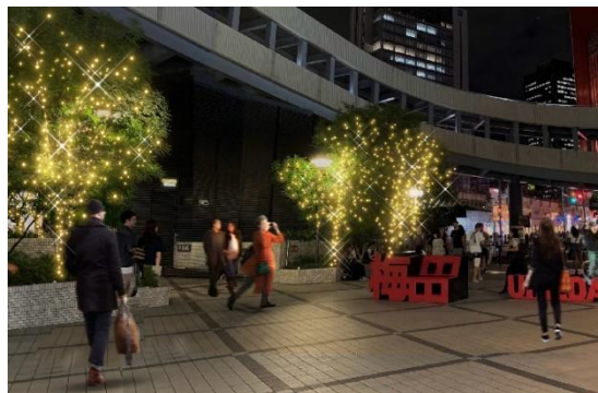
※サテライト会場電飾イメージ