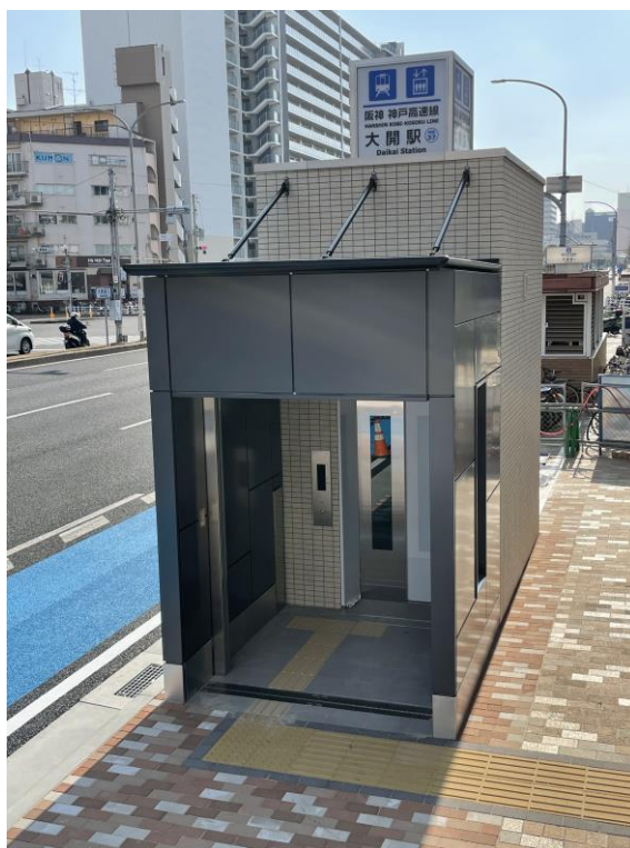
新設エレベーター（地上の外観）