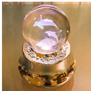
3Dレーザーボールオルゴール 3,400円(税込)