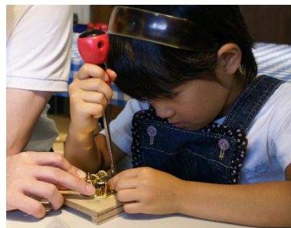
オルゴール組立体験の様子