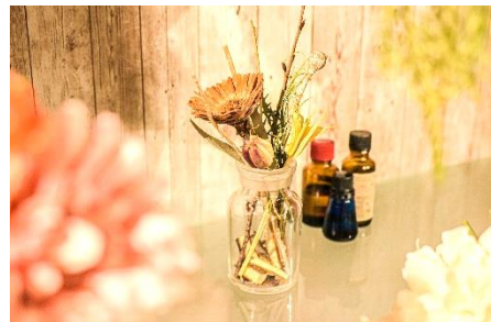
ひんやりルームフレグランス(イメージ)