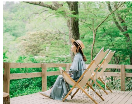
チェアリングイメージ