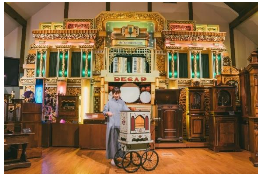
コンサートルームと演奏体験の様子(イメージ)

*2日本音響学会誌掲載 https://www.jstage.jst.go.jp/article/jasj/71/6/71_KJ00009958805/pdf