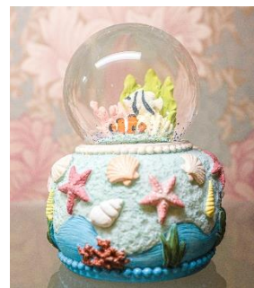
スノードーム(神戸オルゴール) 6,730円(税込)