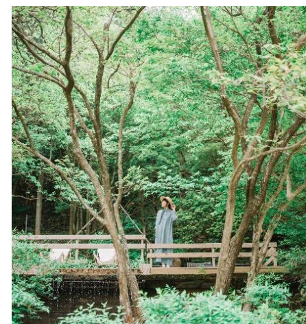
投稿写真イメージ