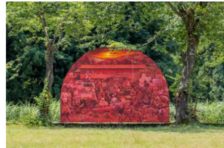
《赤倉の学堂》2015年、 大地の芸術祭 越後妻有アートトリエンナーレ、 新潟県十日町エリア(赤倉村)

30年にわたり、「ナウインプロダクション」のチームとともに手掛けた作品は、国内外の主要な美術機関の評価を受け、収集されている。いまま、美術館での展覧会や国際芸術祭へ参加しながら、社会の変化を反映したコミュニティ・プロジェクトを続けている。