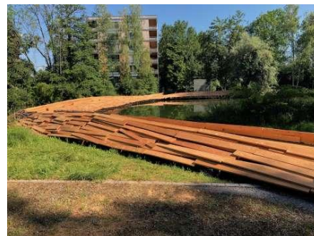
《カワマタ・ブリュック》2022年、スイス

2006年以降、活動の拠点をフランス・パリに移し、パリ国立高等芸術学院にて教授職に就きながら、アーティストとして欧州を拠点に精力的な活動を展開する。彼の仕事に関わっていく分野は、建築や都市計画、歴史学や社会学、日常のコミュニケーション、あるいは医療にまで及ぶ。現在、フランス・パリを拠点に欧州・アジア地域で活動を展開している。