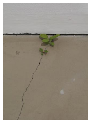
《雑草》2008年 (c) Yoshihiro Suda / Courtesy of Gallery Koyanagi

1993年、銀座のパーキングエリアで初個展「銀座雑草論」を開催。主な個展に原美術館(1999)、シカゴ美術研究所(2003)、国立国際美術館(2006)、丸亀市猪熊弦一郎現代美術館(2006)、ホノルル現代美術館(2009)、千葉市美術館(2012)、渋谷区立松濤美術館(2024)など。