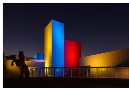
《いろとりどりのかけら》2024年(リニューアル) 常設展示、十和田市現代美術館

光や映像によるパブリックプロジェクション、インスタレーション、パフォーマンス公演など幅広く国内外で活動を行っている。京都市京セラ美術館、東京駅100周年記念ライトアップ、十和田市現代美術館など建築物へのライティングプロジェクトは、ダイナミックで造形的な光の作品を創り出す。多くの人とともに作る「夢のたね」、「ひかりの実」、「ひかりの花畑」など大規模な参加型アートプロジェクトも数多く手がけている。