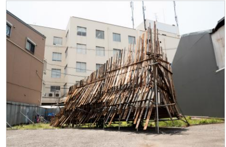
《Generator》2024年、Generator、 北加賀屋千島ビル北側空地(大阪)

まちが生み出した廃材、建築資材、既製品などを使用し立体、インスタレーション、またドローイングや zine を制作。近年は屋外でのインスタレーション作品を通じ人々とその場で生まれる“アートと社会の関係性”という得難い事象に興味がありアートプロジェクトを行う。