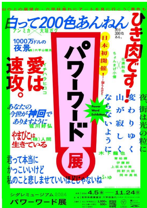
パワーワード展 メインビジュアルイメージ