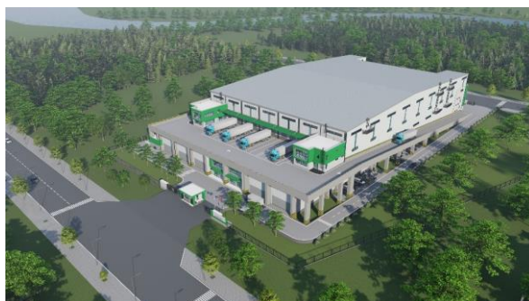
建物の外観（イメージパース）