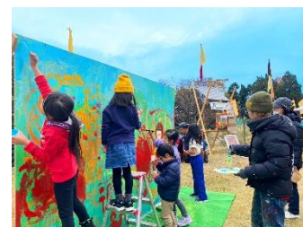
MIZPAM・MOYA 「おおきなキャンバスに絵をかこう」