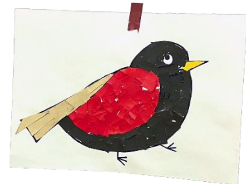
chockmi (チョコミ) 「どうぶつをつくろう」