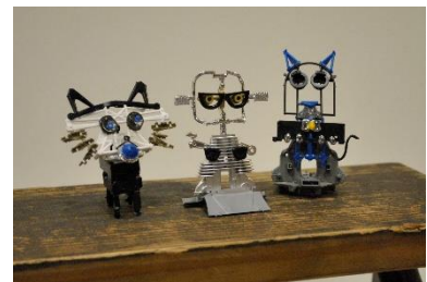
橘宣行「タチバナノブユキのプラモアート」