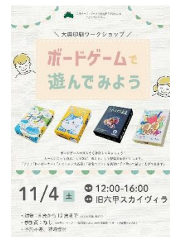
大興印刷ワークショップ 「ボードゲームで遊んでみよう」