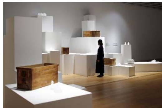
【写真】 左:《夜に降る景色-時計-》2010年 撮影:宮島径 ©MIYANAGA Aiko Courtesy of Mizuma Art Gallery 右:《くぼみに眠る海》2023年 宮永愛子 詩を包む(富山市ガラス美術館、富山) 撮影:木奥恵三 画像提供:富山市ガラス美術館 ©MIYANAGA Aiko