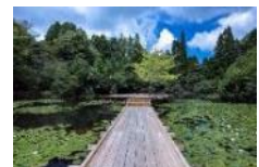
川俣正《六甲の浮き橋とテラス》

過去最多となる招待・公募を合わせた61組のアーティストが参加します。国内外から幅広い視点で活動しているアーティストの作品をご紹介します。また、公募作品の募集条件を向上し、より優れた作品を募集・展示します。