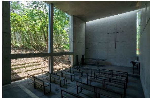
風の教会 左: 外観 右: 内観