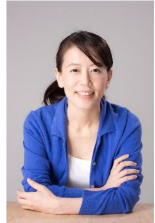
Photography by MATSUKAGE

主な近年の展覧会に、個展「宮永愛子 詩を包む」(富山市ガラス美術館、2023)、個展「宮永愛子-海をよむ」(ZENBI- 鍵善良房-KAGIZEN ART MUSEUM、京都、2023)、「ワールド・クラスルーム:現代アートの国語・算数・理科・社会」(森美術館、東京、2023)等。第70回芸術選奨文部科学大臣新人賞受賞(2020)。