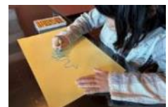
こどもプログラム

ワークショップ等を通じて自然の中で子どもたちが現代アートに触れられる機会を増やし、次世代の文化芸術の担い手や支え手を育てていきます。