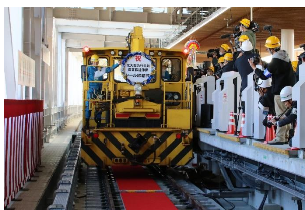
モーターカー発進

【リリース配付先】豊中記者クラブ、青灯クラブ、近畿電鉄記者クラブ、北摂記者クラブ ほか