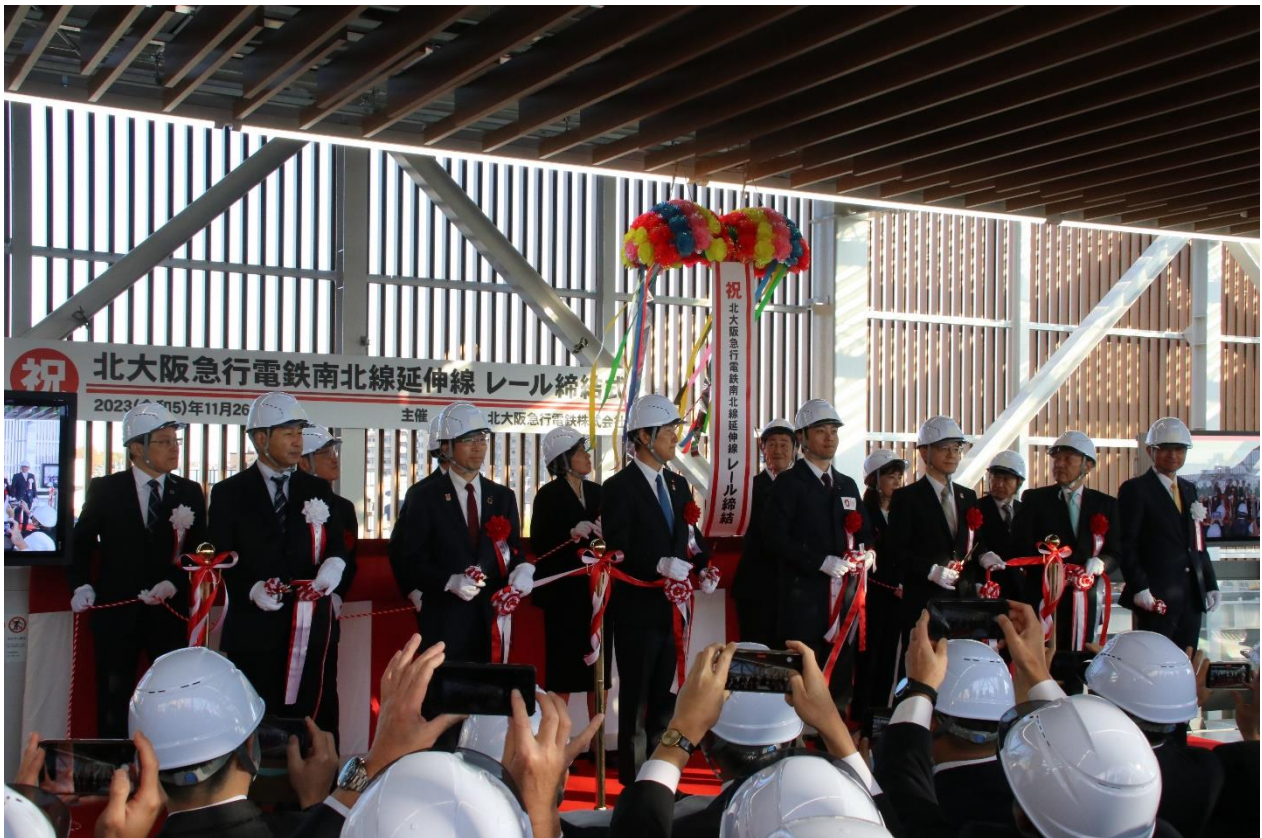
テープカット・くす玉開披

このたび、千里中央駅～箕面萱野駅間のレール敷設工事が完了し、全線のレールが1本につながったことを記念して、さる11月26日（日）に関係者によるレール締結式を箕面萱野駅にて執り行いました。