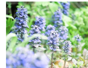
アジュガ(4月初旬～4月下旬) 2022年撮影