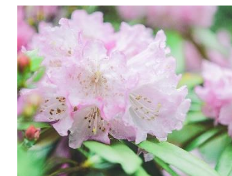
シャクナゲ(4月中旬～5月初旬) 2022年撮影