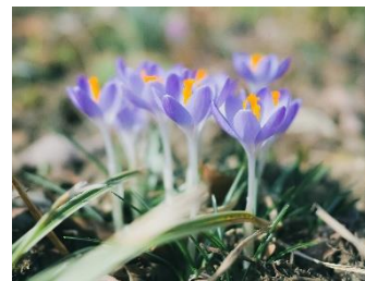
クロッカス(3月初旬～4月初旬) 2023年撮影

当施設内「SIKI ガーデン」では、六甲山の自然と調和したナチュラルガーデンをコンセプトに植栽を行い、約300種類の四季折々の樹木や花々を見ることができます。六甲山は市街地より気温が5℃ほど低い為、春の花の花期が1か月ほど遅くなります。「ヒツジグサの池」の側に設置されたベンチやハンモックで、ウグイスなどの鳥のさえずりに耳を傾けるなど、ゆっくりとした時間が過ごせます。