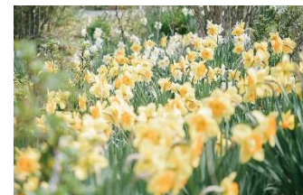
スイセン(3月中旬～4月下旬) 2022年撮影