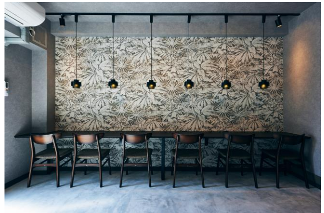
共用部に入居者が利用できる「コミュニティラウンジ」