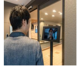
顔認証による解錠 (エントランス)