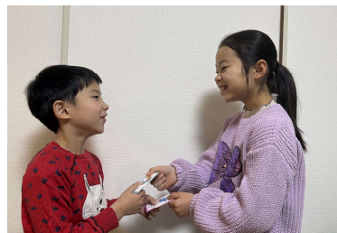
<NPO 法人 a little>

■3月25日(水) 阪急西宮ガーデンズにて、未就学児から中学生までご予約無しで参加可能