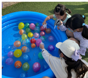
<任意団体 バレット>