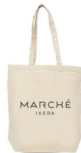
リニューアルオープン記念品（イメージ）