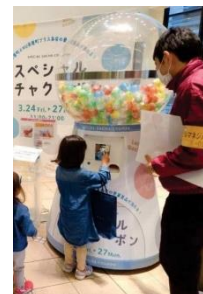
スペシャル抽選会（イメージ）

【内容】期間中に1,000円（税込、合算可）以上ご利用いただいたレシートのご提示で、素敵な景品が当たるスペシャル抽選会に1回ご参加いただけます。