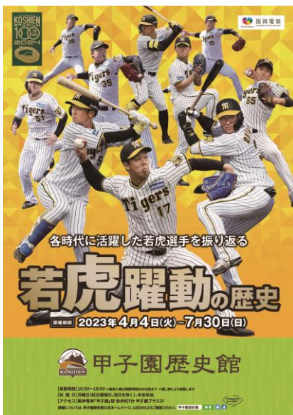
ポスターイメージ