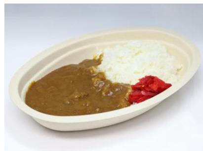
<甲子園カレーの新容器>