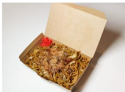
<甲子園焼きそばの新容器>

球場内売店で使用しているプラスチック製の容器・包材（2019シーズンのプロ野球時で全販売点数のうち約60%に使用）を、紙をはじめとするバイオマス製品に変更し、プラスチックの使用量を削減します。既に甲子園焼きそばを2020年10月から、甲子園カレーを2021シーズンからバイオマス製品に変更（甲子園焼き鳥は従来から紙包材を使用）し、甲子園3大グルメの包材を全てバイオマス素材としています。将来的には、全ての販売商品の包材をバイオマス素材に変更します。