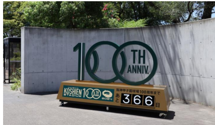
1塁側外周に設置されたカウントダウンボード

イベント後半には、初代スコアボードの書体を再現したカウントダウンボードがお披露目され、100周年を迎える2024年8月1日に向けたカウントダウンが開始されました。1塁側外周には、お披露目されたカウントダウンボードが設置されました。3塁側外周の「OBAYASHI-SITE」にも、2代目スコアボードの書体を再現したカウントダウンボードが登場しました。