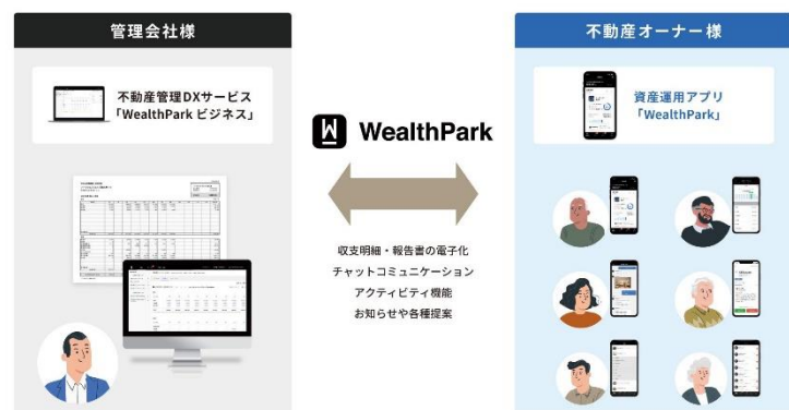
SaaS 事業『WealthPark ビジネス』概要