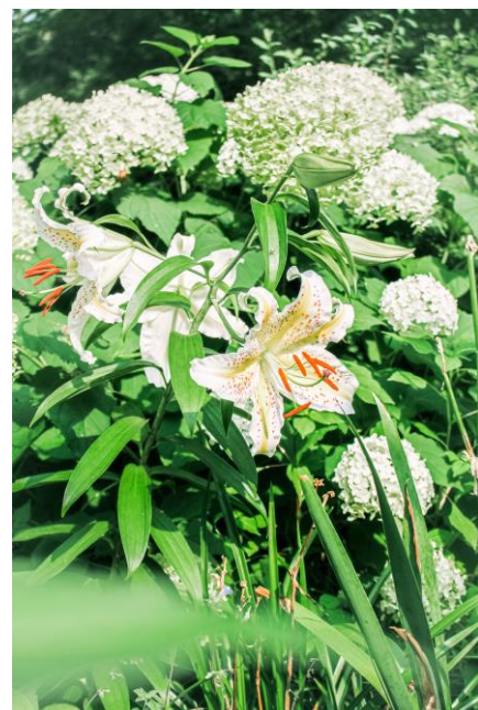
SIKI ガーデン内のアジサイ 前:ヤマユリ 後ろ:アナベル(アジサイの1種)