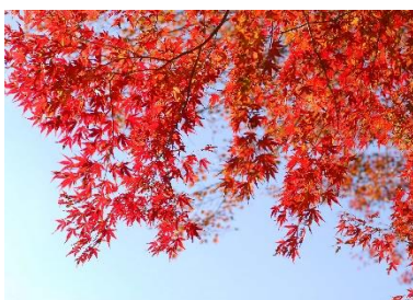
イロハモミジ(11月上旬～中旬)