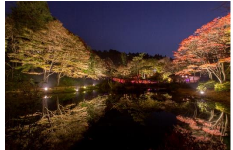
紅葉ライトアップ