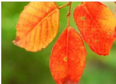
シラキ(10月中旬～下旬)

カエデやツツジの仲間など定番の紅葉木のほか、シロモジやコアジサイ、高山植物のチングルマなど多種多様な植物が赤色～黄色に色づきます。 日本最大級ともいわれるドウダンツツジの紅葉も見ごたえがあります。