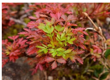
チングルマ(11月上旬～中旬)