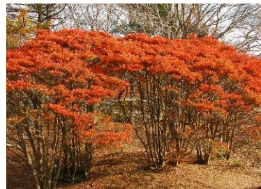
ドウダンツツジ(11月上旬～下旬)