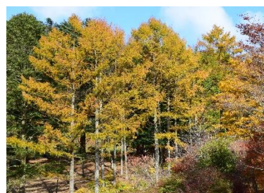
カラマツ(11月上旬～中旬)