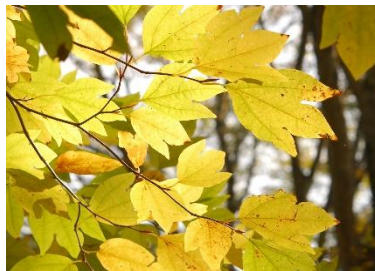
シロモジ(10月下旬～11月上旬)