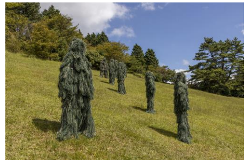
昨年の神戸市長賞 (対象：公募アーティストの作品) KIMU「green on green」2020年