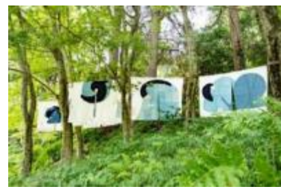
史枝《連なる思い》 2020年 六甲高山植物園