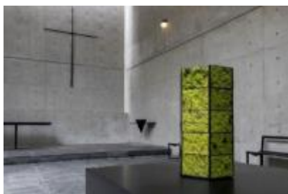
山城大督《Monitor Ball》ver. Rokko》 2020年 風の教会