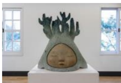
中村萌《Grow in silence》 2020年 六甲山サイレンスリゾート