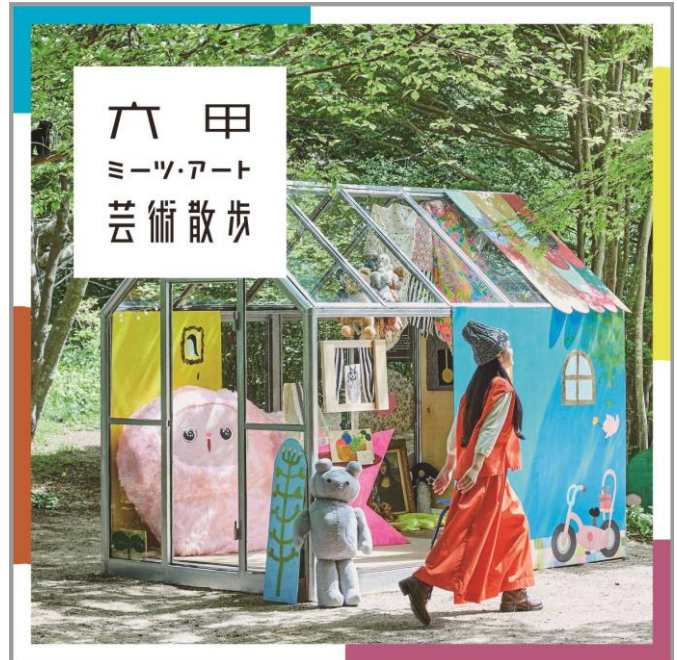
Art work: 長井朋子《小さな家 The Little House》2021 ©Tomoko Nagai, Courtesy of Tomio Koyama Gallery/ Photography: Akira Yamaguchi / Design: Akihiro Hama (KOBE DESIGN CENTER) / Place: 六甲高山植物園

また、新たな試みとして神戸市、西日本旅客鉄道株式会社、株式会社神戸新聞会館と連携し、8月27日から JR 三ノ宮駅前でも特別展示を行います。六甲ミーツ・アート芸術散歩の過去の人気作品を、アクセス抜群の三宮エリアにて無料でご覧いただける絶好の機会です。