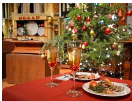
クリスマスディナー(イメージ)