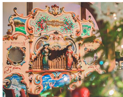
コンサートルーム