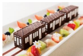
阪急電車型ケーキ