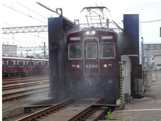
正雀車庫 洗車(イメージ)