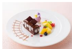
阪急電車型ケーキ