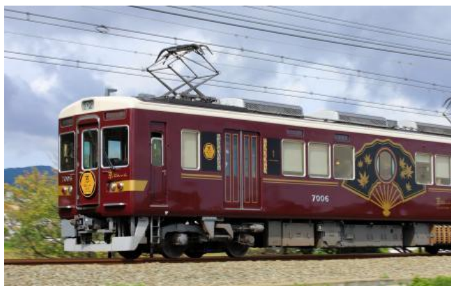
観光特急「京とれいん 雅洛」