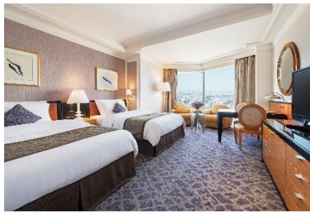
トレインビュールーム (一例)