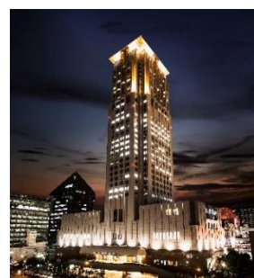
ホテル阪急インターナショナル外観